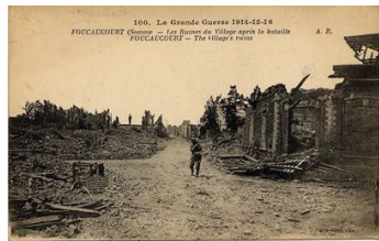
Ruines de Foucaucourt