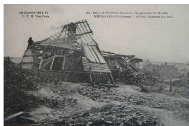
Ruines du moulin de Bouchavesnes