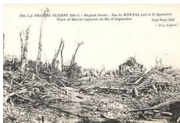
Vue de Morval