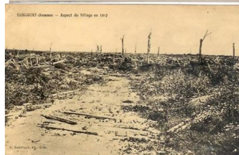
Ruines de Rancourt