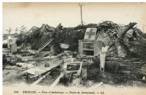
Une ambulance en Champagne