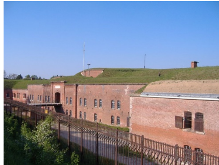
Le fort d'Ingolstadt, transformé en camp de prisonniers