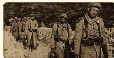
Le ravitaillement en soupe de la tranchée