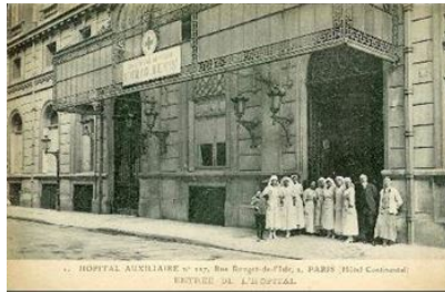
Un hôpital auxiliaire parisien