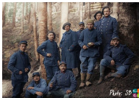
Chasseurs alpins « diables bleus » au repos